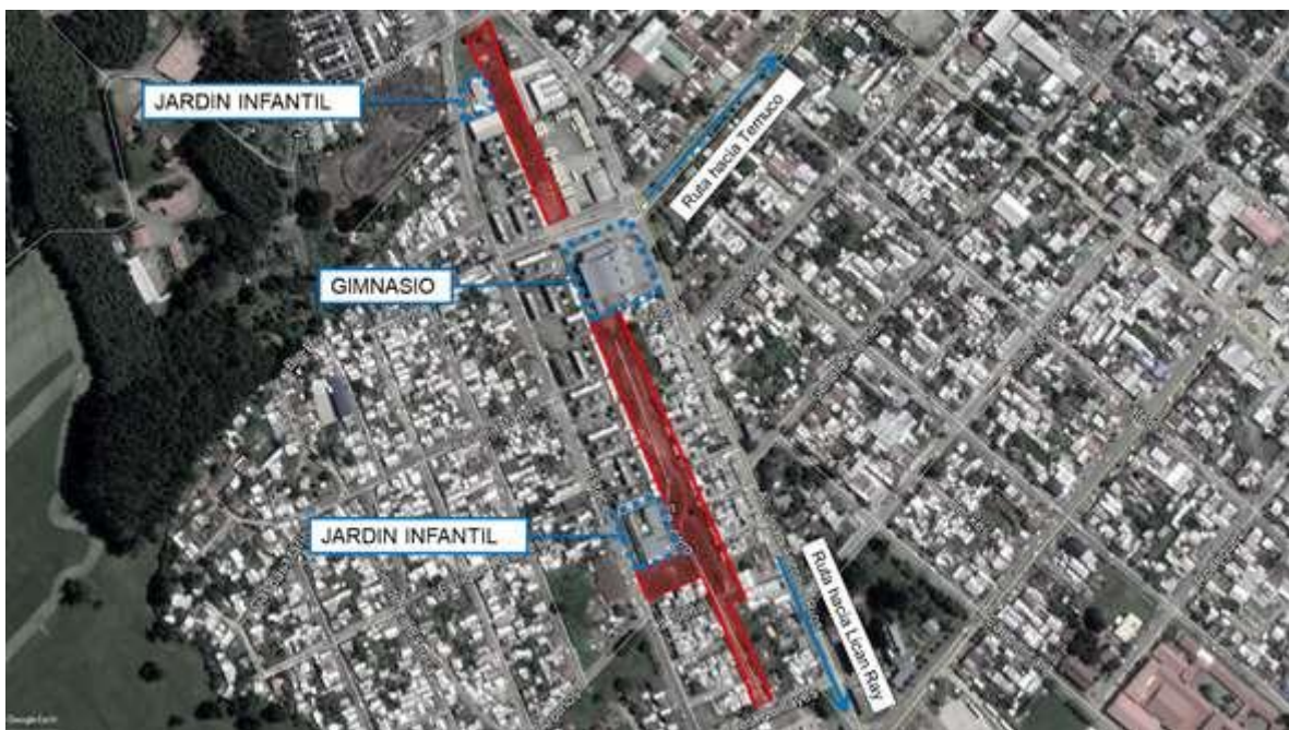
Figura N°4: Referencia de ubicación de terrenos propuestos.

El SERVIU, designará a los funcionarios encargados de actuar como moderadores y acompañar el proceso de presentación a las familias. Los que deben resguardar el desarrollo de la actividad de acuerdo a las presentes bases permitiendo que las familias realicen la elección definitiva de su Entidad Patrocinante y Empresa Constructora.