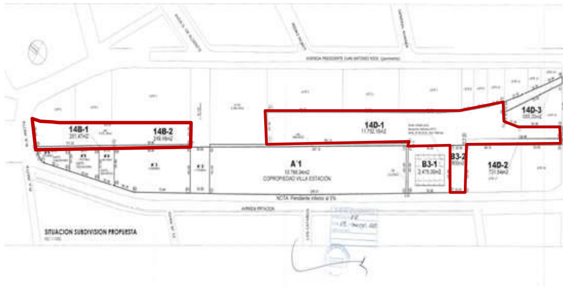
Figura N°1: Ubicación terreno

Junto a lo anterior, toda Entidad Patrocinante interesada en presentar una propuesta, declarará conocer las condiciones en que deberá desarrollar el proyecto, sin ser ello una justificación para el incumplimiento de las condiciones establecidas en la presente convocatoria.