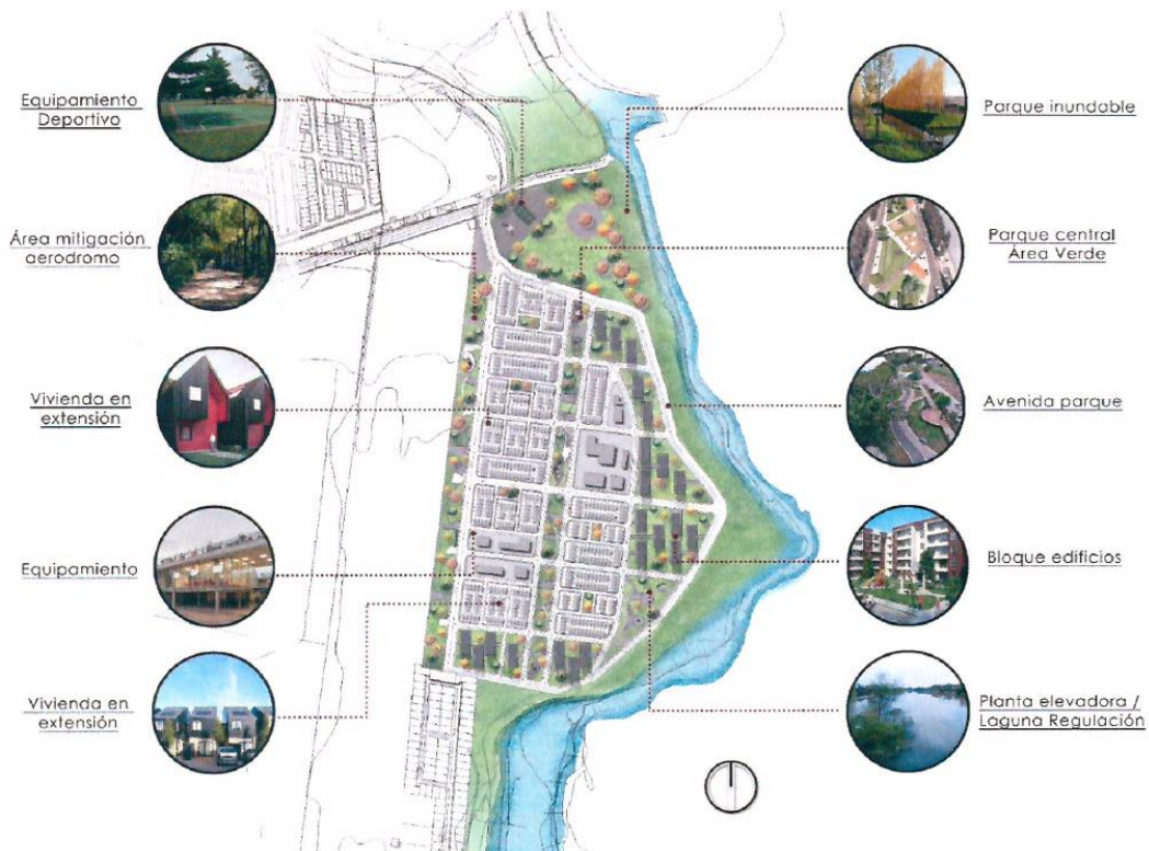
Figura N°5: Imágenes referenciales de Plan Maestro