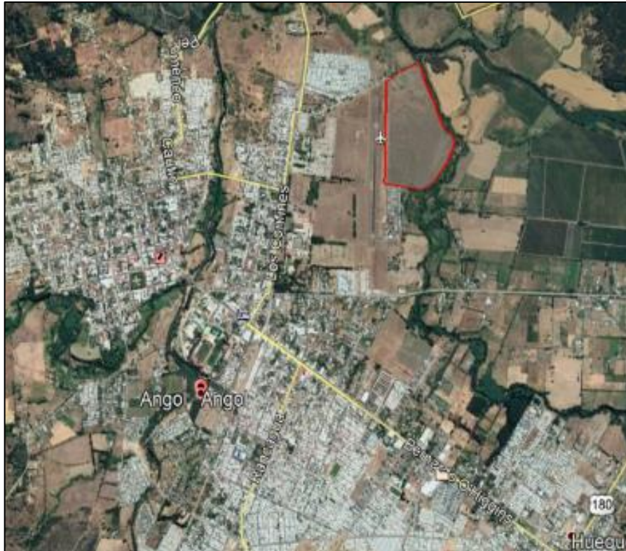
Figura N°2: Ubicación terreno

A la fecha el terreno cuenta con estudios y antecedentes que se entregaran a la entidad ganadora.